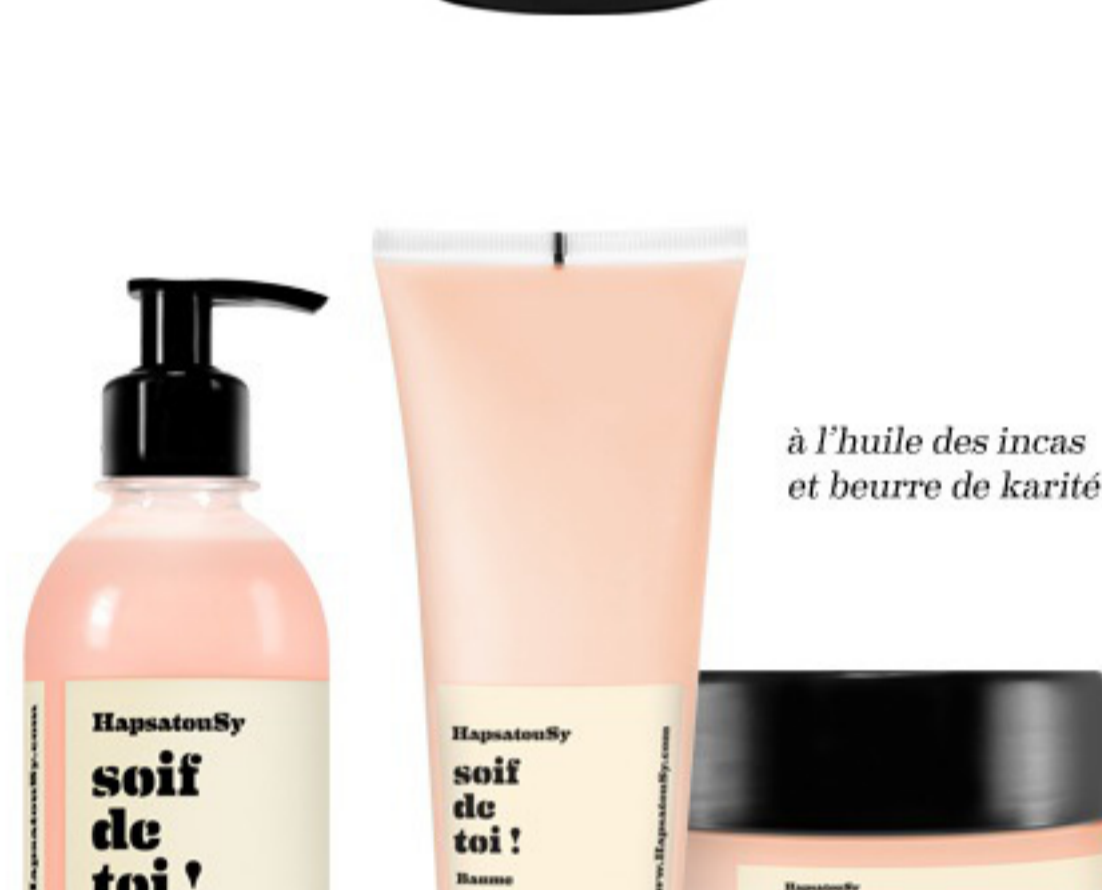
à l'huile des incas et beurre de karité