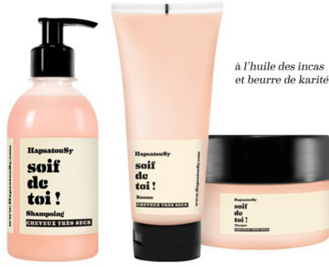
à l'huile des incas et beurre de karité