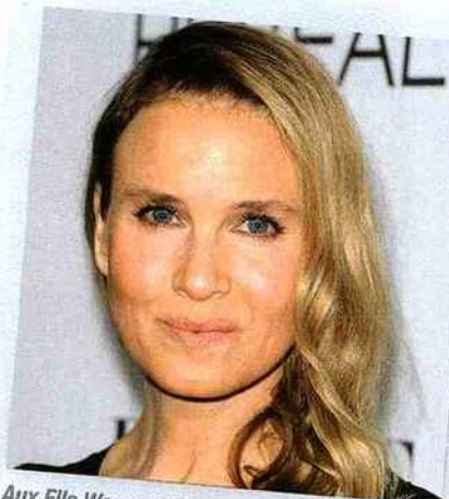
Aux Elle Women in Hollywood Awards d'octobre dernier, Renee Zellweger portait ses cheveux en une cascade ondulée en one shoulder.