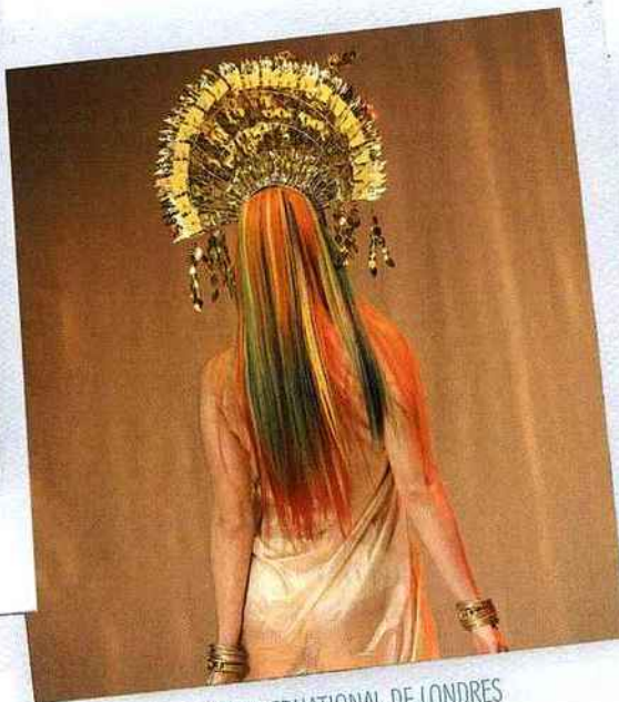
SALON INTERNATIONAL DE LONDRES Aveda Master Jam.