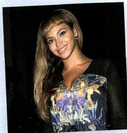
Renouveau capillaire pour Beyoncé, qui arbore une frange coupée ultra-courte, loin de remporter l'approbation des médias.