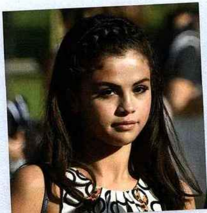
Pour le défilé Louis Vuitton lors de la Fashion, Selena Gomez avait tressé son imposante chevelure façon serre-tête.