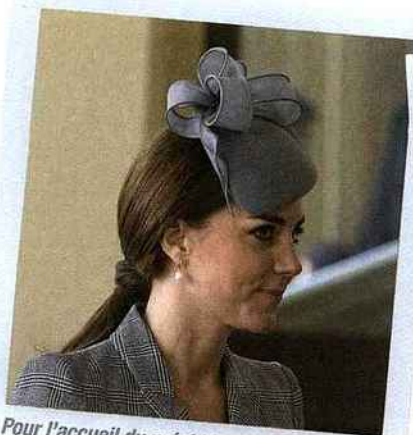
Pour l'accueil du président de Singapour, Kate Middleton avait noué ses cheveux en queue-de-cheval basse, avec pointes wavy.