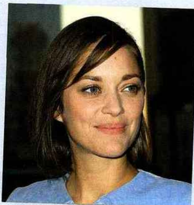
Au Festival du film de New York, Marion Cotillard a joué la sobriété, avec carré lisse et mèche balayée sur le front.