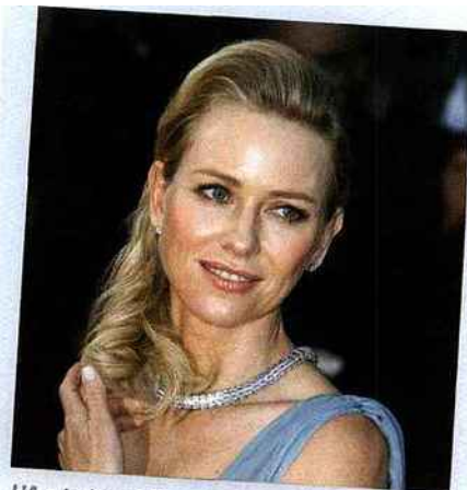
L'Australienne Naomie Watts est la nouvelle égérie de L'Oréal Paris. Elle sera à l'affiche de « Seas of Trees » et de « Birdman ».