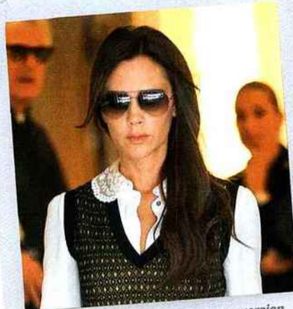
Victoria Beckham a réussi sa reconversion, Elle a été sacrée « entrepreneur britannique de l'année » par « Management Today ».