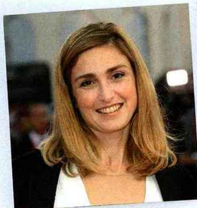
Au Festival de Deauville en septembre dernier, Julie Gayet affichait une coiffure simple, cheveux lâchés sur les épaules.