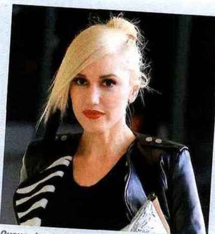
Queue-de-cheval haute et longue mèche lissée pour Gwen Stefani. Pour son nouvel album, la chanteuse a fait appel à Pharrell Williams.