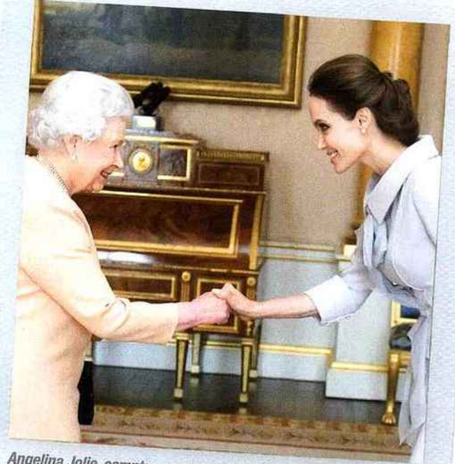
Angelina Jolie, somptueuse dans son tailleur bleu ciel et coiffée d'un chignon bas élégamment sophistiqué, pour recevoir sa décoration de « Dame Commandeur », des mains de la reine Elizabeth II à Buckingham Palace.

JUBILÉ Indémorable Mireille Mathieu, qui vient de fêter à L'Olympia son jubilé, soit ses 50 ans de carrière. La gardienne de la chanson française sort un album Best Off de trois CD. Souvent moquée, la coupe au bol de Mireille Mathieu, inchangée depuis 1965, est désormais imitée. « Regardez les magazines, ma coupe est aujourd'hui à la mode ! Il y a quelques années, j'avais fait une petite entorse à mon look habituel, en optant pour une coupe à la Louise Brooks. J'aimais bien, mais le public, lui, n'appréciait pas. Alors, j'ai reculé, le public est roi ! », assure Mireille. La mythique chanteuse avignonnaise envisage aujourd'hui de sortir un duo avec l'excentrique Lady Gaga. Les deux artistes se sont, en effet, rencontrées dans les coulisses de l'émission « C à Vous » et ont visiblement sympathisé.